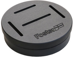
Sujetador de cuchillo